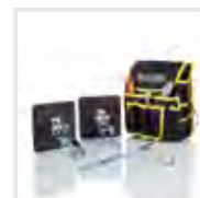
Praktische Helfer 2 Bestell-Nr. 19328