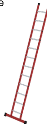
Abb. Bestell-Nr. 35312

mit rutschsicheren Leiterschuh (liegt ab Leiterlänge 3,0 m lose bei)