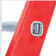
4-fach gebördelte Sprossen- / Holmverbindung

Details auf der jeweiligen Produktseite unter www.steigtechnik.de