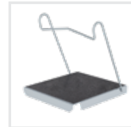
Einhängetritt R 13 Bestell-Nr. 19910