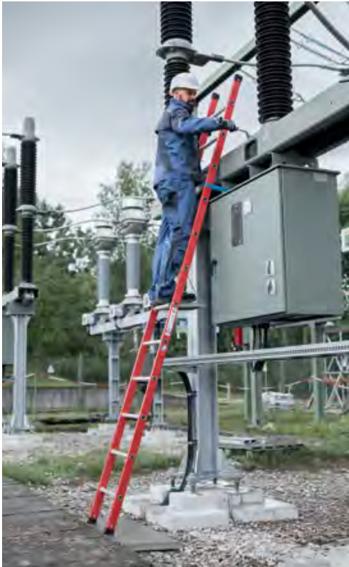
Abb. Bestell-Nr. 35012 mit Bestell-Nr. 19910