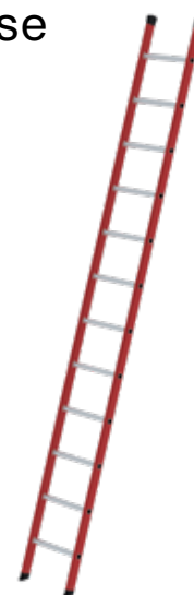
Abb. Bestell-Nr. 35012