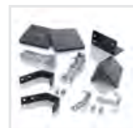
Leiterkopfsicherungen Komplett-Set Bestell-Nr. 19309