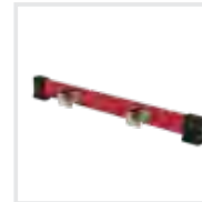
Nachrüst-Traverse Bestell-Nr. 30373